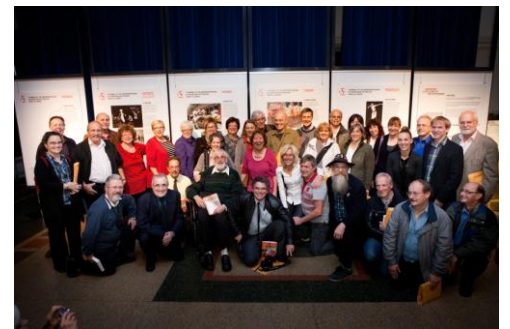
Les anciens Sortilèges 24 novembre 2012